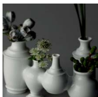
【N-18 PROOF OF GUILD】